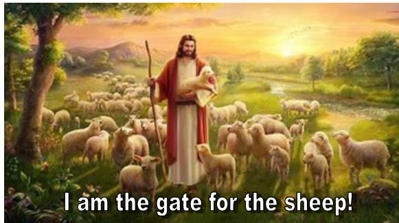
I am the gate for the sheep!

DALY MASS - Msza św. codzienna Monday - Saturday: 8:00 am - English (Rector) Piątek: 7:00 pm - Po polsku (Kościół) THE DEVOTION / Nabożeństwa HOLY HOUR: First Friday's, 7:30 pm Chaplet of Divine Mercy: 7:30 am (Rector) THE CONFESSION / Spowiedź Saturday: 4:00 - 4:55 pm Monday/Friday: 7:30 am - 7:55 am RECTORY OFFICE Tuesday-Friday: 12:30 pm - 5:30 pm