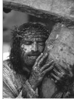
Padres están ofreciendo misas privadas por sus intenciones.

LECTURAS DE LA SEMANA 04:12: Acts 10:34-43; Col 3: 1-4; Jn 20:1-9 04:13: Acts 2:14, 22-33; Ps 16; Mt 28:8-15 04:14: Acts 2:36-41; Ps 33; Jn 20:11-18 04:15: Acts 3:1-10; Ps 105; Lk 24:13-35 04:16: Acts 3:11-26; Ps 8; Lk 24:35-48 04:17: Acts 4:1-12; Ps 118; Jn 21:1-14 04:18: Acts 4:13-21; Ps 118; Mk 16:9-15 04:19: Acts 2:42-47; 1 Pt 1:3-9; Jn 20:19-31